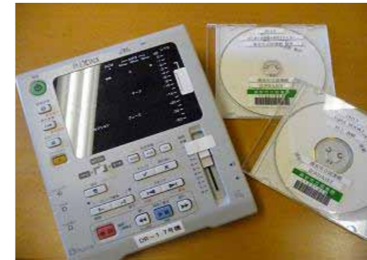
デジータ図書と専用プレイヤー