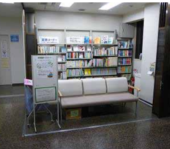
市内の病院や特別養護老人 ホームへの貸出を行っています