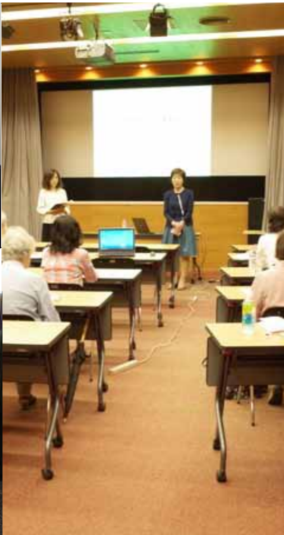
特別な資料を作るための制作協力者 講習会を開催しています