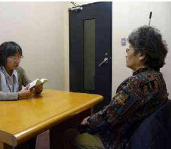
視覚が不自由な方へ図書館員が 対面朗読をします

誰もが使いやすい 図書館サービス (図書館利用が困難な方への ハンディキャップ・サービスのご案内)